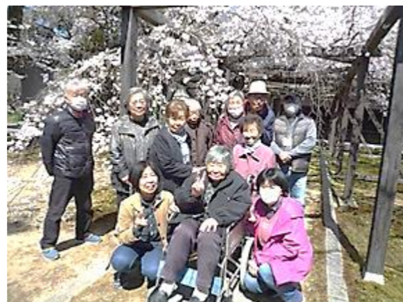
長誓寺のしだれ桜にて

この時期、ピリピリした毎日の中、デイサービスでは少しでも楽しい時間を過ごしてもらえよう工夫を凝らしたいと思います。