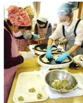
手作りギョーザを楽しむ