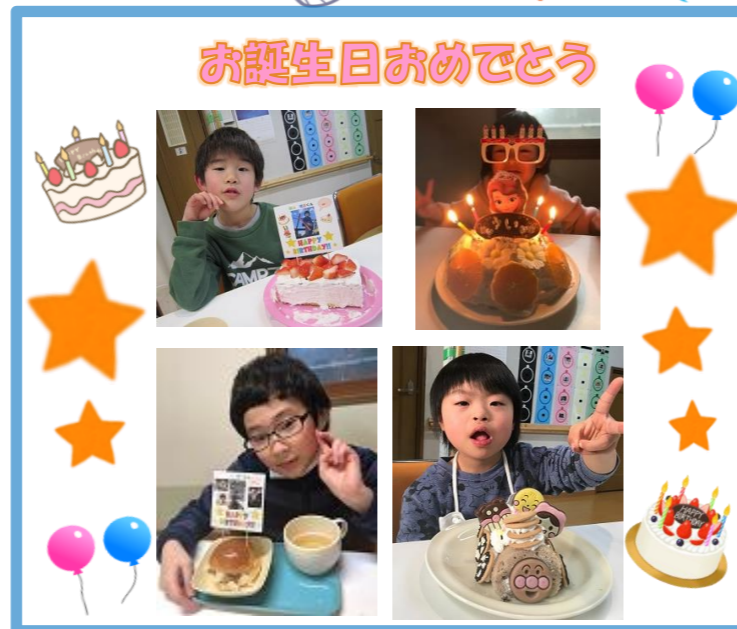
お誕生日おめでとう