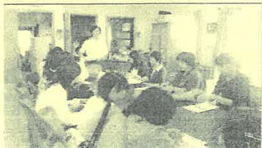
大池施設長の説明に聞き入る参加者