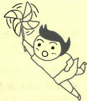
まごころ児童デイに来て いる子たちの作品もあり ました。 みんな力作です!