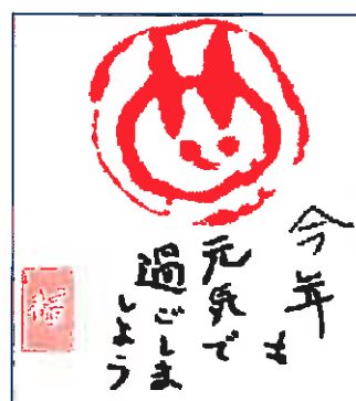
出来あがった作品 うさぎの芋版画です