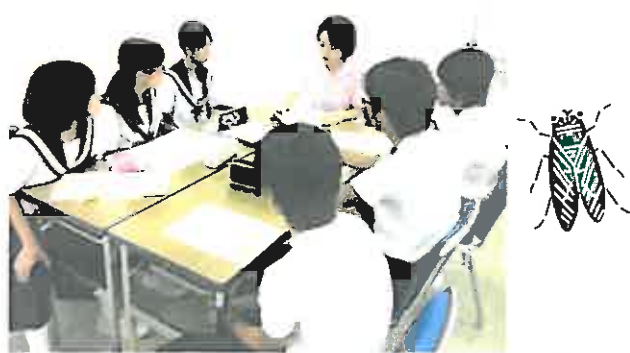
まごころへは西成中学校と北部中学校の生徒さんが研修に参加されます