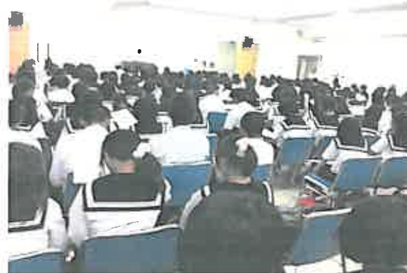
仲間の報告に聞き入る生徒たち

7月23日(月)一宮市スポーツ文化センターに市内中学生と高校生(北高、西高、木曾川高、修文女子高)のボランティアが参加し体験報告と今年度の研修に向けて、施設職員とのオリエンテーションが開催されました。