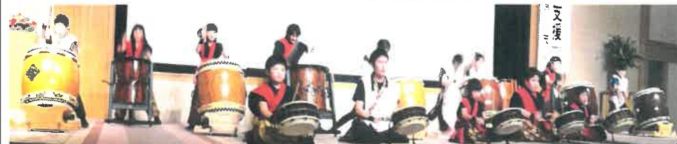
講演前に披露していただいた子どもたち(巴)の太鼓演奏は迫力もあり、すばらしい演奏でございました