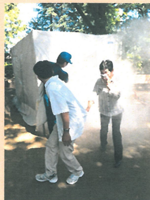
煙の中を避難している参加者

9 月 7 日 (日) の定例会の後、隣の九品地公園にて煙体験を含む地避難訓練。その後、消火器による消火訓練そして、ふれあい広場にて AED 等の救急救命訓練を実施しました。