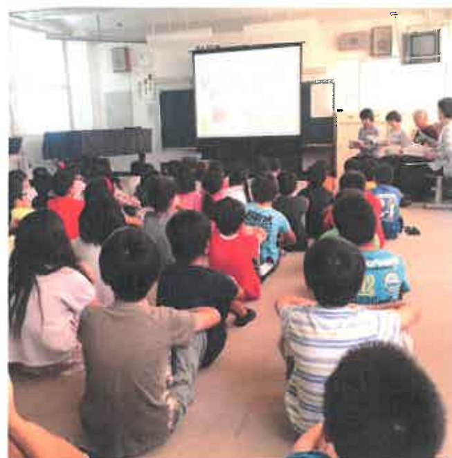
石ガ瀬小学校 4 年生のみなさん (愛知県大府市)

9 月 25 日 (木) あいち福祉ネットではモリコロ基金の助成を受けて大府市の小学校で認知症サポーター研修を始めました。