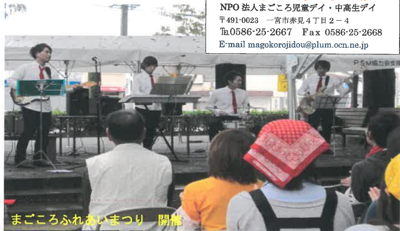
まごころふれあいまつり 開催

前日の土砂降りだった雨もあがり、11月2日(日)は何とかまつりの時間は降らないでくれました。NPO法人かくれんぼの楽団による軽快な音楽でスタートしました。