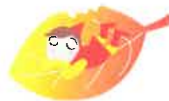
手創り御輿でわっしょい