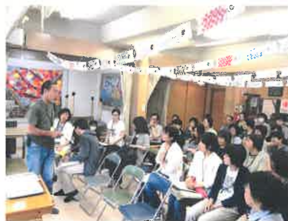
交通事故原因を検討する協力会員

この研修の背景には「繰り返し起こる事故や交通事故を防げなかったらどうか？」という疑問がありました。『ヒヤリ・ハット』の報告を活かして、どうしたら事故を無くせるかを皆で考えました。