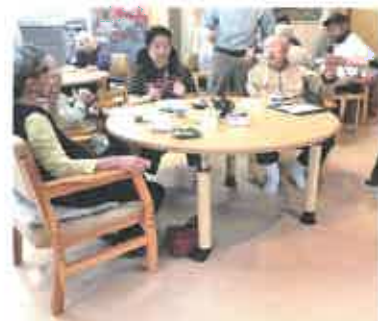
輪になり話が弾むサロン風景