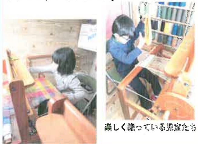
楽しく織っている児童たち