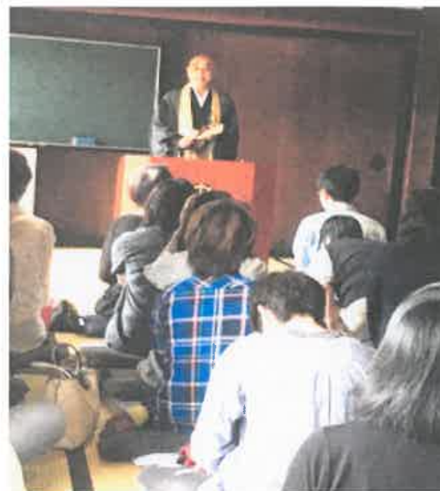
妙興寺 20代目稲垣住職の法話