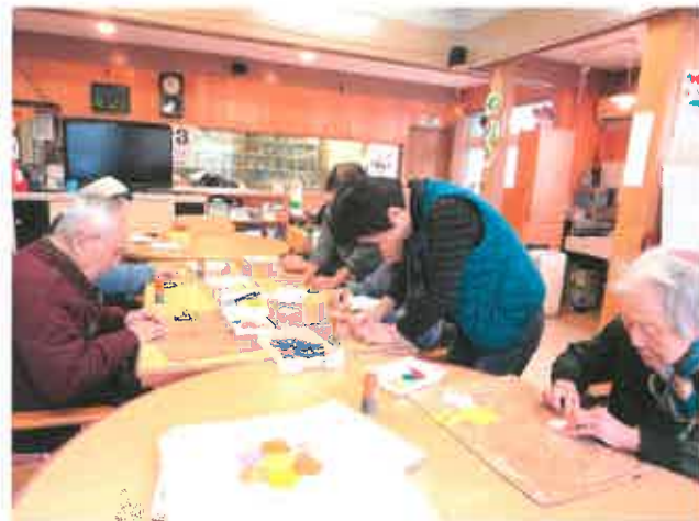
折り紙で六角の花作り・・・