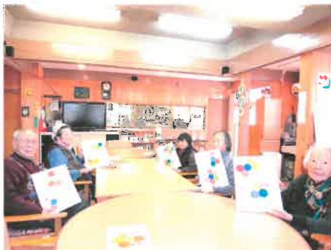
色とりどりの花ができました！