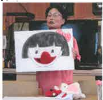
歯科衛生士さんの楽しい嚥下体操

2月は「節分」の豆まき行事に、それぞれが鬼の絵を描いて「豆まきゲーム」を行いました。春はもうすぐやって来ます！