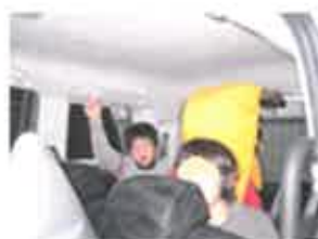
防災頭巾を付けて避難する児童(左)と車内で仲間を待っている児童(右)