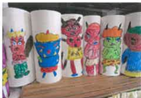
ユーモラスな鬼のボール「節分」に活用