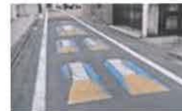
スピード減速表示