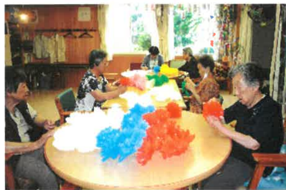
七夕飾り付け、皆で「内職作業みたい!」

一宮七夕まつり市民飾り付けコンクールに今年も出品いたします。その作業に利用者さんにも関わってもらいました。ぜひ現物をご覧ください!