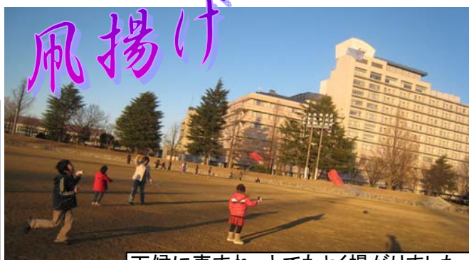
天候に恵まれ、とてもよく揚がりました。

初詣では真清田神社に行きました。お参りの後、出店でカステラを買い、みんなで食べました。 クッキングは特にカレーが人気！皆どどんおかわりしていました。また、意外(?)にも「おでん」が好評で、作る工程も楽しかったようです。