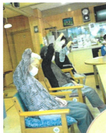
毎日の機能向上トレーニング