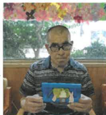
月見うさぎの作品とともに