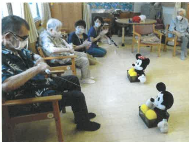
集団でレクを楽しむ…