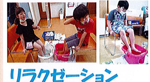
リラクゼーション