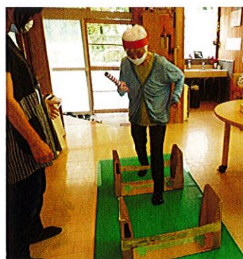
リレーでハードルを越え