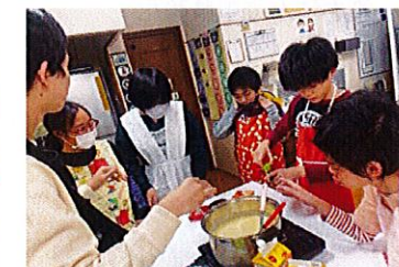
クッキング大好き