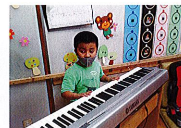
音楽活動トミック♪