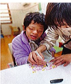
季節の工作タイム