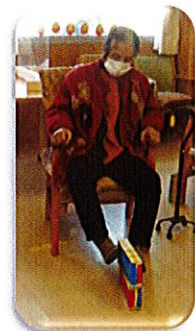
箱を積んで下肢強化