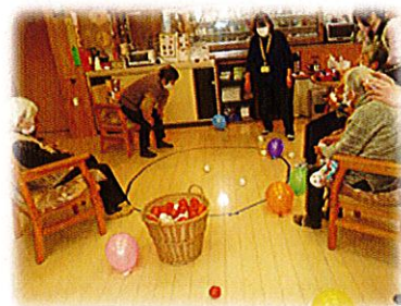
風船追い出しゲーム