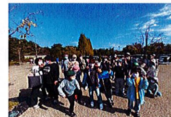
フラワーパークにて