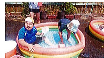
夏はやっぱり水遊び