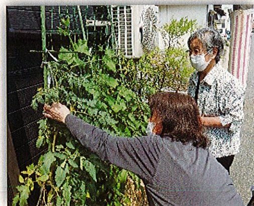
きゅうりに茄子にトマト、夏野菜のお世話!